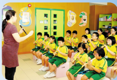
木童笛易學難精，同學專注的練習，互相配搭，十分精彩。