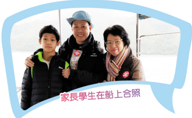
家長學生在船上合照