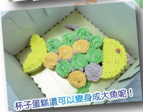
杯子蛋糕還可以變身成大魚呢！