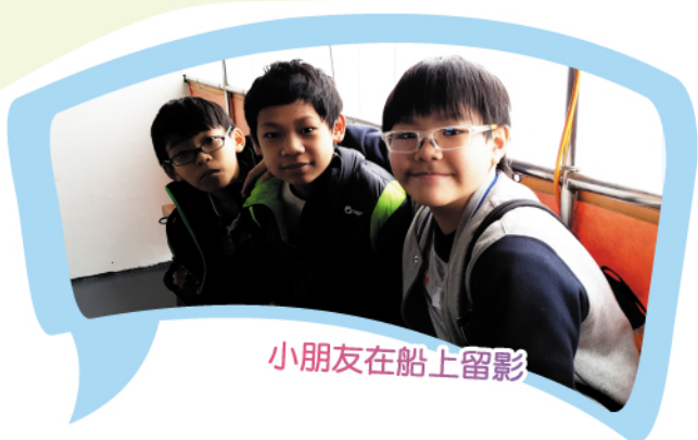
小朋友在船上留影