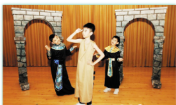
同學完全投入在話劇中， 齊心練習，特別醒目。