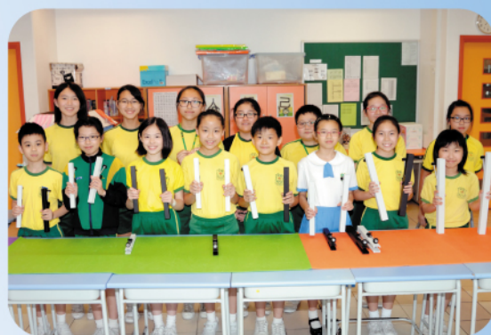
學校安排多元化的興趣班給同學選擇，手鐘班是其中一個特色的音樂興趣訓練，同學都十分喜歡。