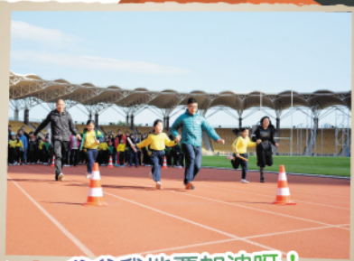
爸爸我地要加油呀!