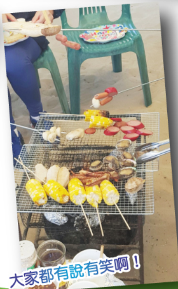
大家都有說有笑啊！