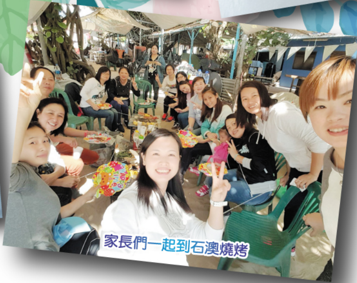
家長們一起到石澳燒烤