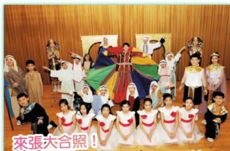
來張大合照！ 經過幾個月的英文綵排及訓練， 同學的自信心都增加了！

主角約瑟特別受父親的寵愛，令十一個兄長非常嫉妒。一天，約瑟外出牧羊，不幸被兄長賣給人口販子，更輾轉被賣到埃及。兄長們對父親謊稱約瑟因意外死了，父親悲傷不已。約瑟在埃及工作，本來十分順利，卻被人陷害而身陷牢獄。因約瑟擁有神所賜予的解夢能力，能為法老解夢，使埃及順利渡過長達七年的饑荒，他因此成為了埃及的宰相。最後，約瑟的父親、兄弟因饑荒到埃及買糧，重遇約瑟。約瑟以愛寬恕出賣他的兄長，以德報怨，最終大團圓結局。