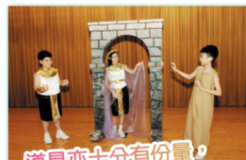
道具亦十分有份量， 每次練習都要全部準備好， 再加上同學專注的練習， 互相配搭，十分精彩！