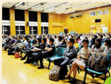
家長投入專注聆聽講員分享

每年家教會與學校都會合辦家長班，邀請多位資深專業的講員分享許多在維繫家庭和諧、教養孩子和處理壓力等專題，深受校內與校外家長歡迎，令家長和孩子獲益良多。