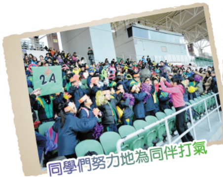
同學們努力地為同伴打氣