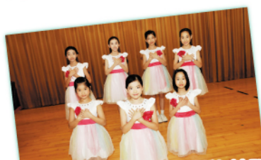
同學的甜美笑容，流利的英語對白， 積極參與，我們都十分期待你們的演出。