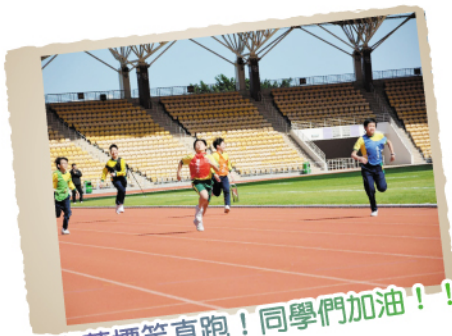
向著標竿直跑! 同學們加油!!