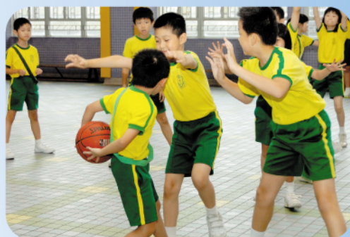
籃球訓練可以提升團隊合作及守紀律，同學真用心，大家都投入積極參與。