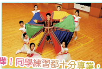
嘩！同學練習都十分專業， 打扮成小主角， 大家為你們的努力而驕傲。