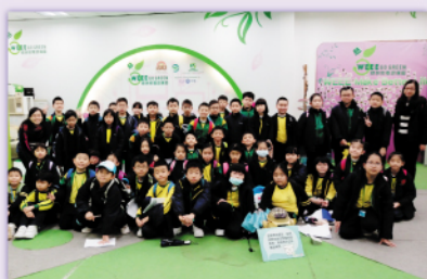
我們一起來減少廢物