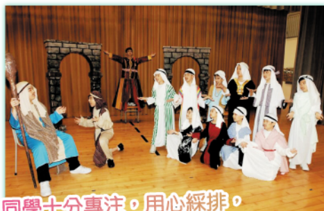
同學十分專注，用心綵排， 為英文音樂劇公演作出最好準備，加油！