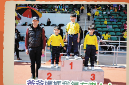
爸爸媽媽我得左喇!!