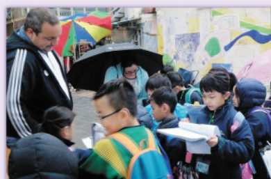
香港是否吸引遊客的地方？