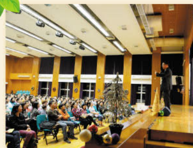
講員分享有關提升EQ的專題