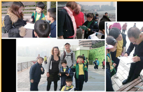
三年級：香港旅遊好去處