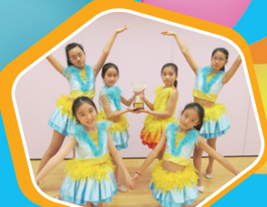
香港學界舞蹈協會主辦第五十一屆學校舞蹈節小學高年級組中國舞(群舞)甲級獎

升中派位成績理想 ：近九成學生獲派第一志願的中學，九成半以上學生獲派首三個志願的中學。