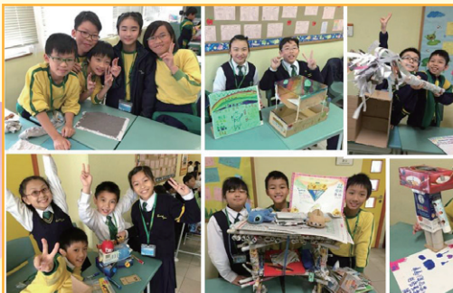
四年級：我們一起來減少廢物