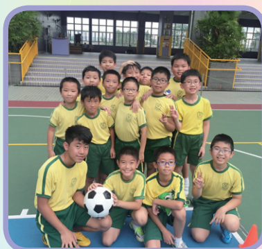
週六活動-足球隊合照