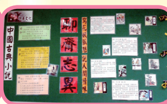
中華文化--古典小說壁報