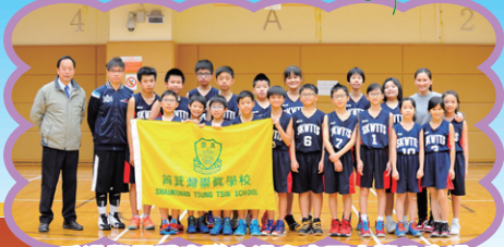
香港學界體育聯會港島東區小學分會港島東區小學校際籃球比賽男子組冠軍