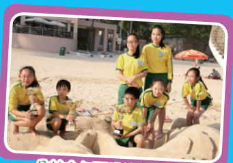
公益少年團堆沙比賽冠軍