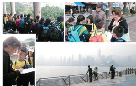
學生訪問訪港旅客