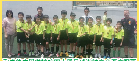
聖貞德中學鑽禧校慶小學足球邀請賽金盃賽冠軍