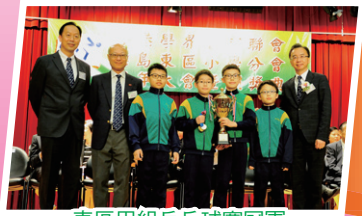
東區甲組乒乓球賽冠軍