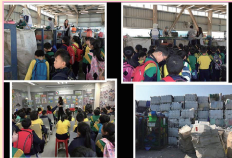
四年級：我們一起來減少廢物