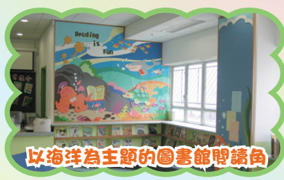
以海洋為主題的圖書館閱讀角