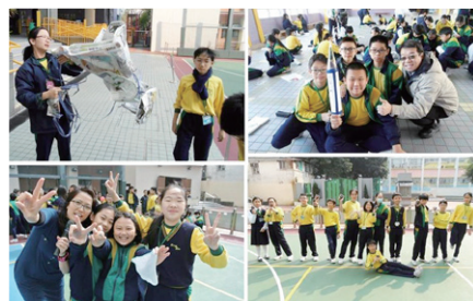
探究水火箭的動力學