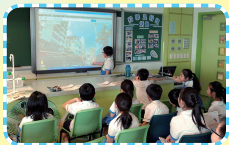
使用電子白板學習