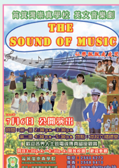
The Sound of Music