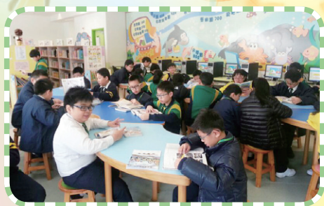
圖書課「從閱讀中學習」