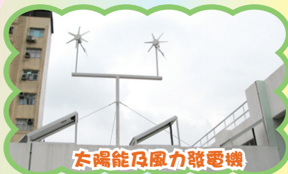
太陽能及風力發電機