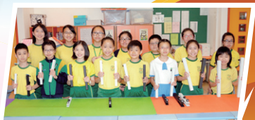
手鈴及手鐘(小學組)金獎