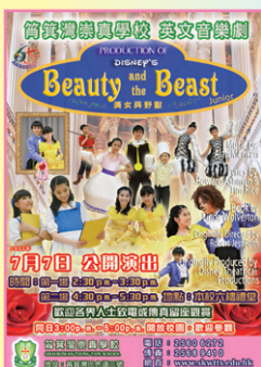
Beauty and the Beast