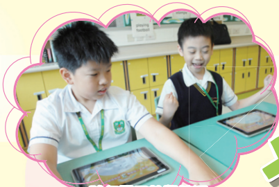
試行電子教學情況