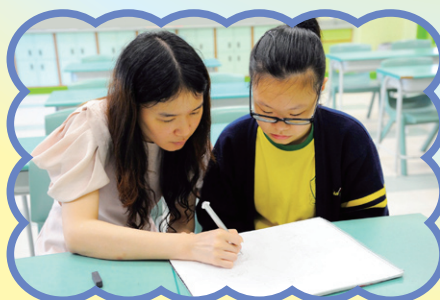
週六活動-繪畫班(高級組)