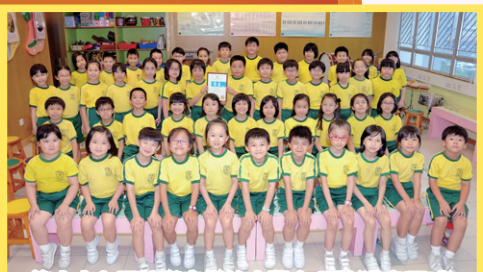
第六十七屆校際音樂節小學合唱隊(港島區域)中文(男、女子)中級組(8歲或以下)組別季軍