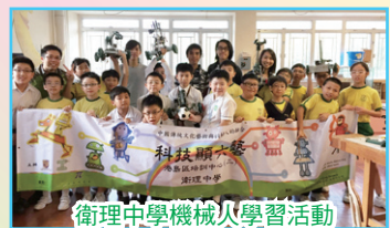
衛理中學機械人學習活動