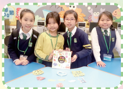
圖書組「閱讀活動樂趣多」

此外，透過圖書課閱讀策略的教授，幫助學生從閱讀中學習，成為具有閱讀素養的優質讀者，引領他們「從閱讀中學習」，步向終身學習的階梯。