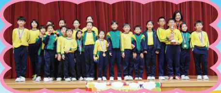
小學雜藝聯校賽團體總冠軍