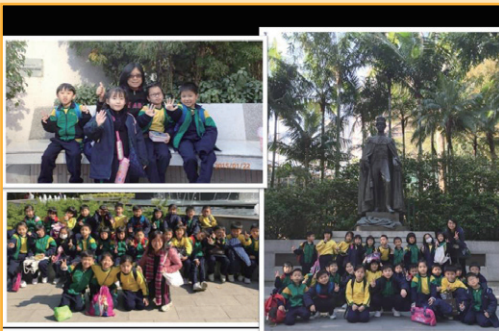
一年級：公園多樂趣