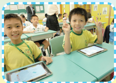
使用平板電腦學習

本校同學亦積極參與外界資訊科技比賽活動，曾獲得全港電子書設計比賽冠軍、香港電腦教育學會主辦的電子學習套件製作比賽的優秀研習報告獎、優秀創意獎及組別一等獎等卓越成就。