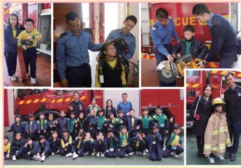
二年級：為我們服務的人