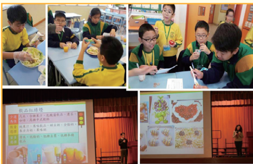
五年級：我是有「營」人