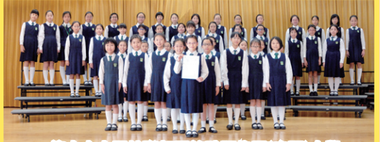
第六十六屆校際朗誦節詩詞集誦(粵語)小學五、六年級女子組亞軍