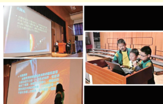
學生匯報學習成果