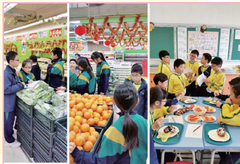
五年級：我是有「營」人