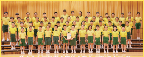
第六十七屆校際音樂節小學合唱隊(港島區域)中文(男、女子)中級組(10歲或以下)組別季軍