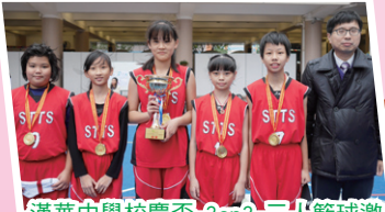
漢華中學校慶盃 3on3 三人籃球邀請賽女子組冠軍