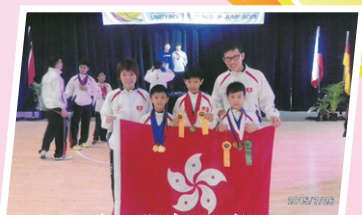
花式跳繩巴黎錦標國際賽冠軍