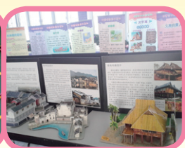
中華文化學習日展覽