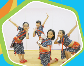
香港學界舞蹈協會主辦第五十一屆學校舞蹈節小學低年級組兒童舞(群舞)優等獎