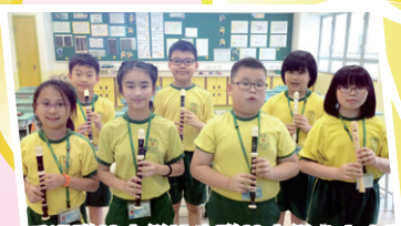
香港聯校音樂協會聯校音樂大賽小學牧童笛組金獎