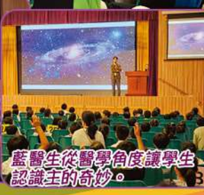
藍醫生從醫學角度讓學生認識主的奇妙。