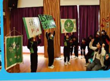
現場氣氛熱烈，各社社員都互相支持打氣。