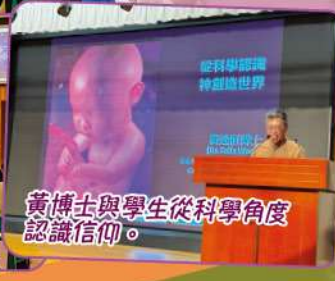
黃博士與學生從科學角度認識信仰。