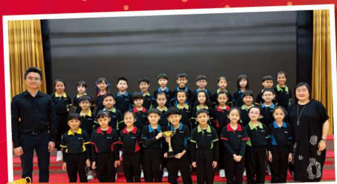
初組歌詠及高組歌詠隊 都分別取於聯校音樂大 賽 2025 中取得金獎， 可喜可賀！