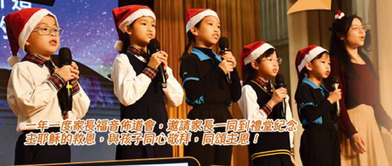
一年一度家長福音佈道會，邀請家長一同到禮堂紀念主耶穌的救恩，與孩子同心敬拜，同頌主恩！