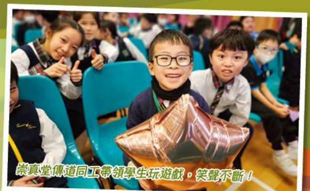
崇真堂傳道同工帶領學生玩遊戲，笑聲不斷！