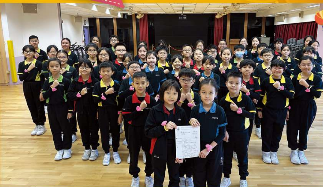
粵語集誦隊獲得亞軍