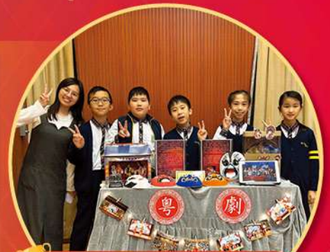
心繫國家雲遊中國非物質 文化遺產虛擬實境設計比賽 獲得最受歡迎設計獎