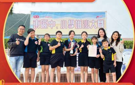
「東區中小學堆沙大賞」獲得小學組亞軍