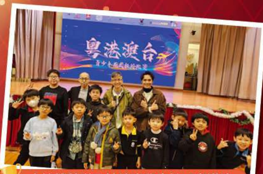
本校雜藝隊及扯鈴班學生於「粵港澳台青少年花式扯鈴比賽」中勇奪佳績！