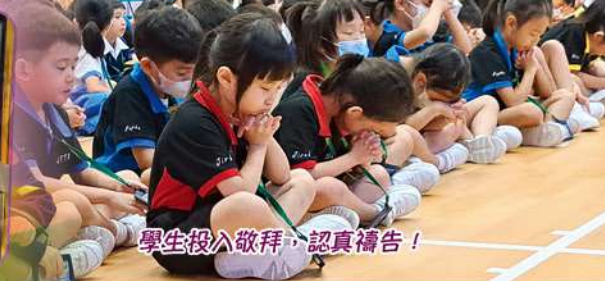
學生投入敬拜，認真禱告！