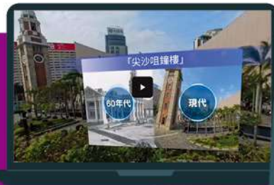
原來60年代的尖沙咀鐘樓是這般模樣，相信同學也大開眼界。

本校和香港大學教育學院教育應用資訊科技發展研究中心的團隊合作，利用嶄新的VR技術，把課文內容製作成虛擬實景影像。戴上眼鏡裝置後，學生即以沉浸式方式，視覺、聽覺並重，體驗課文中所描述的景致及情景，讓學生安坐課室也有親歷其境之感。課文不再停留在乏味的紙上，而是躍然眼前。同學們都格外投入課堂，學得更愉快、更具體、更紮實。