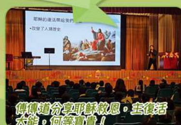
傅傳道分享耶穌救恩，主復活大能，何等寶貴！