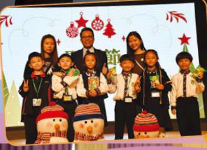
學生親手製作聖誕禮物，向家人分享福音！