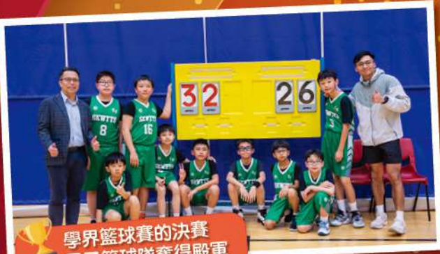
學界籃球賽的決賽 男子籃球隊奪得殿軍