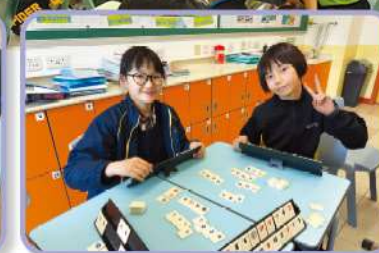
除了算術，同學參與各項智力遊戲競賽均有不錯的成績。