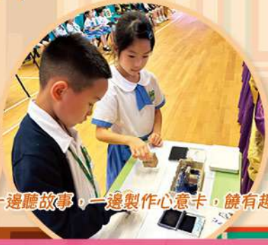
同學在講座中一邊聽故事，一邊製作心意卡，饒有趣味。