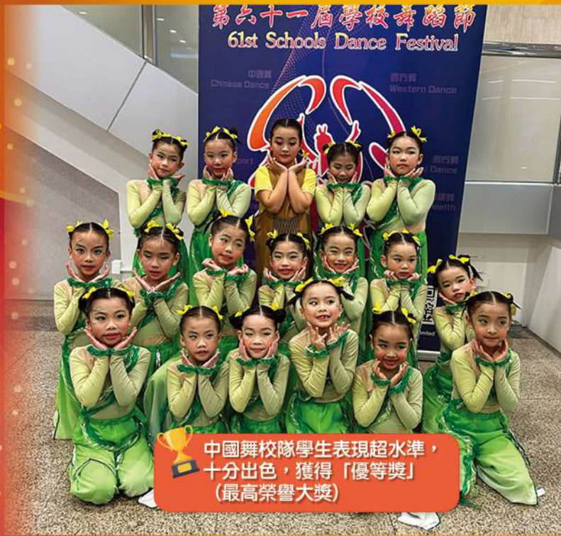
中國舞校隊學生表現超水準， 十分出色，獲得「優等獎」 (最高榮譽大獎)