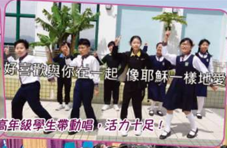
好喜歡與你在一起 像耶穌一樣地愛