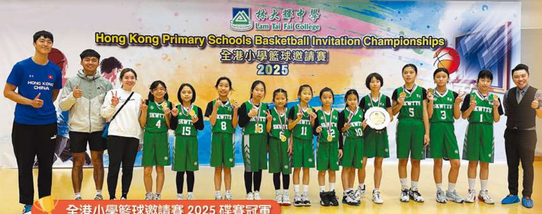
全港小學籃球邀請賽 2025 碟賽冠軍