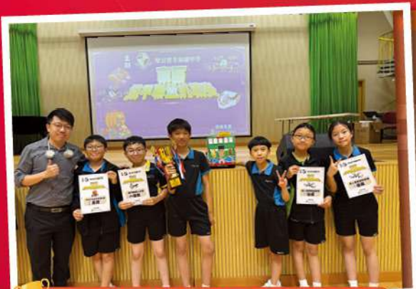
本校電腦小精英六位成員，參加由李福慶中學主辦的東區機甲聯盟挑戰。每年賽事的比賽項目屢屢創新，考驗學生應用 stem 能力，學生為預備比賽付出了不少努力，最後獲得佳績，更在 Robomaster 巡遊比賽榮獲金獎殊榮。