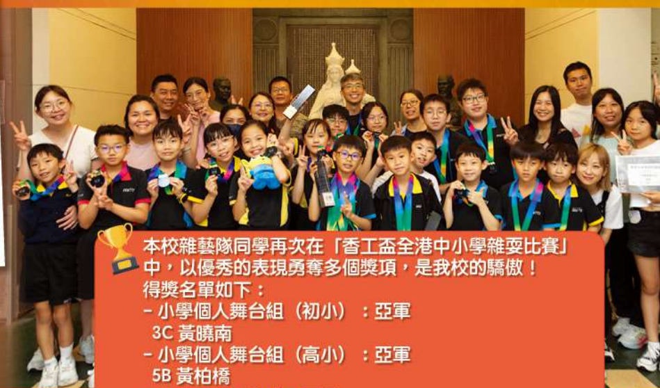
本校雜藝隊同學再次在「香工盃全港中小學雜耍比賽」中，以優秀的表現勇奪多個獎項，是我校的驕傲！