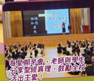
每星期早會，老師與學生分享聖經真理，鼓勵全校活出主愛！