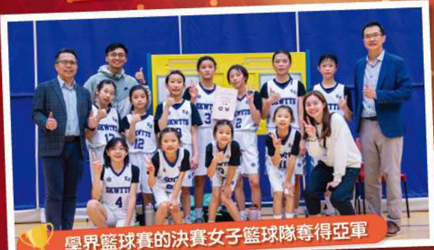
學界籃球賽的決賽女子籃球隊奪得亞軍