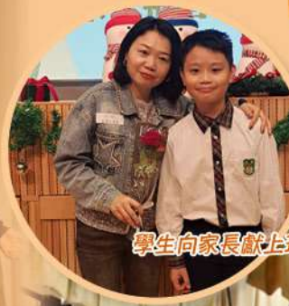
學生向家長獻上玫瑰花，表達祝福與感恩！