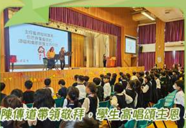
陳傳道帶領敬拜，學生高唱頌主恩！