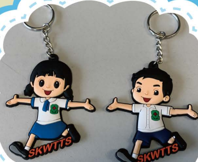
男女同學模樣匙扣定價 20元一個 38元一對(兩個)