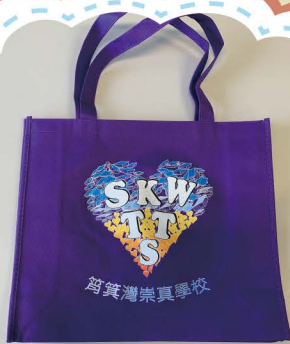
環保袋定價10元一個