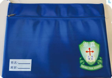
功課袋定價38元一個

家教會歷年來製作了不少紀念品，例如：功課袋、環保袋、男同學和女同學模樣的匙扣及文件夾，希望凝聚大家對崇真學校的歸屬感。