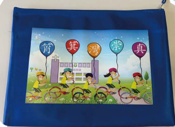
文件夾定價5元一個