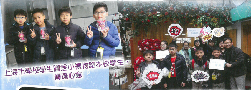
上海市學校學生贈送小禮物給本校學生，傳達心意