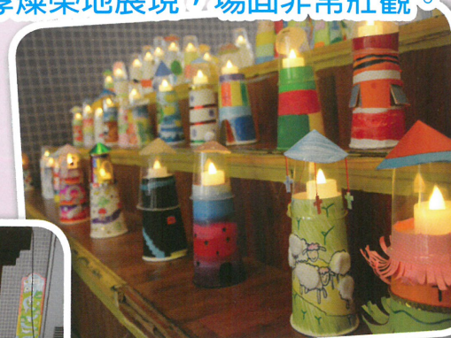
本年度的主題 - 黑暗中的明燈