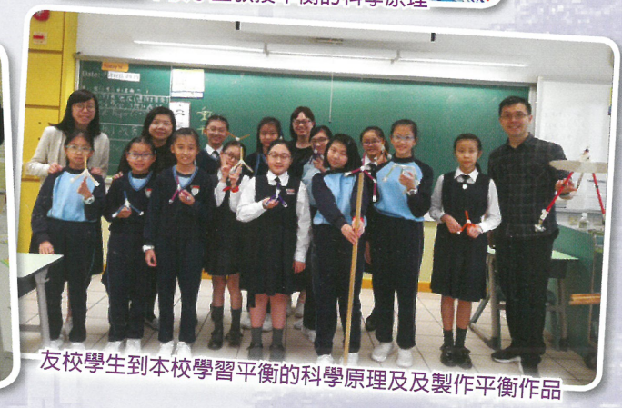
友校學生到本校學習平衡的科學原理及製作平衡作品