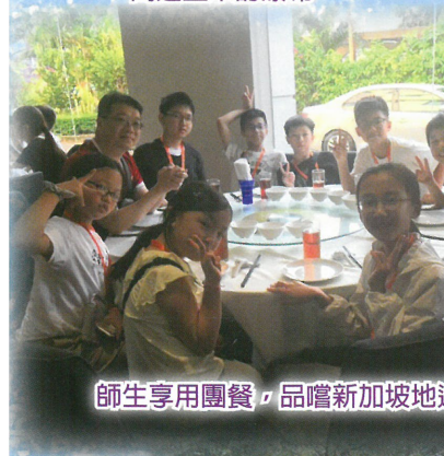
師生享用團餐，品嚐新加坡地道美食