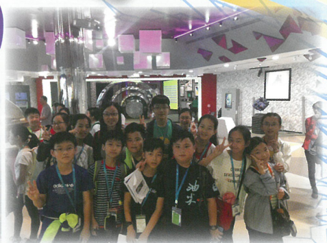
師生在科學館學習科學原理