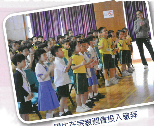
學生在宗教週會投入敬拜

當燈泡亮起來，便寓意崇真學生願意為主發光發亮，成為黑暗中的明燈。這些都是神在本校師生的生命裏工，當集合眾人的見證，恩典便豐厚燦榮地展現，場面非常壯觀。