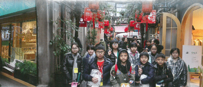
師生逛上海特色小街