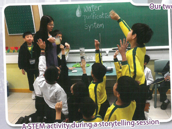
A STEM activity during a storytelling session