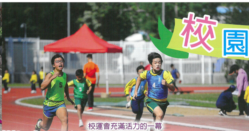
校運會充滿活力的一幕