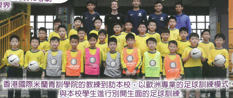
香港國際米蘭青訓學院的教練到訪本校，以歐洲專業的足球訓練模式與本校學生進行別開生面的足球訓練