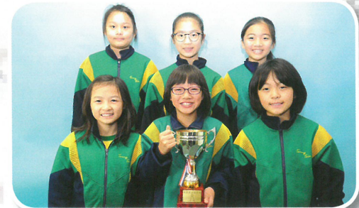
東區分齡田徑比賽女子 F 組 (6-9 歲) 4x100 米接力季軍