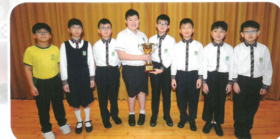
魔力橋 (RUMMIKUB) 小學邀請賽小四至小六團體冠軍