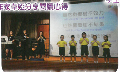
復活節合組週會，學生在台上敬拜