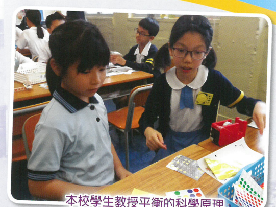
本校學生教授平衡的科學原理