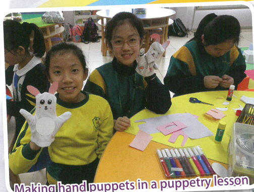
Making hand puppets in a puppetry lesson