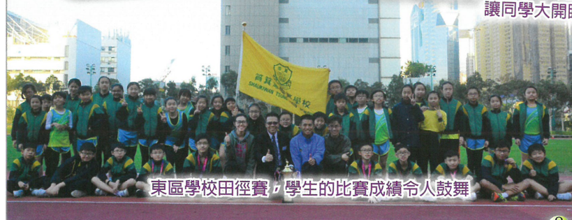
東區學校田徑賽，學生的比賽成績令人鼓舞