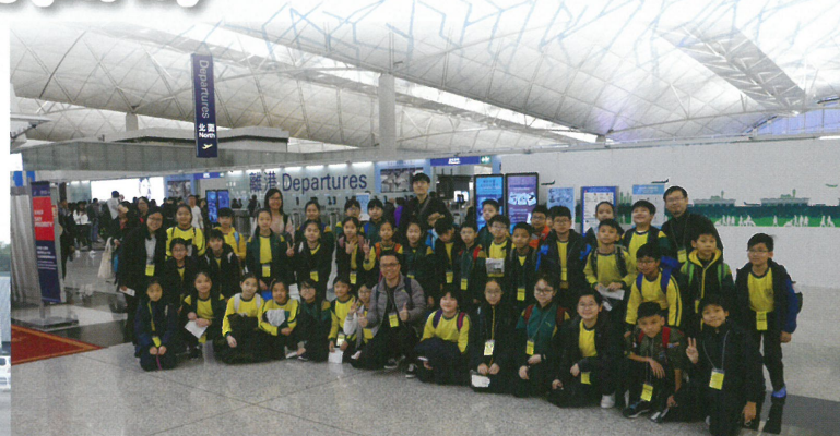
本校學生到上海交流，心情十分興奮