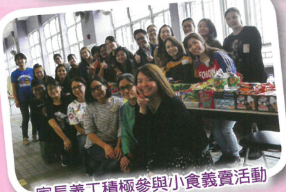
家長義工積極參與小食義賣活動