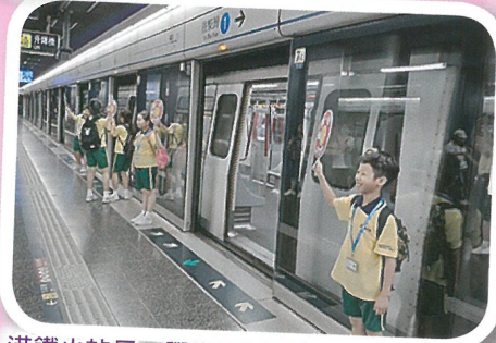
港鐵小站長，學生可以了解地鐵日常運作