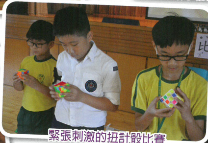
緊張刺激的扭計骰比賽