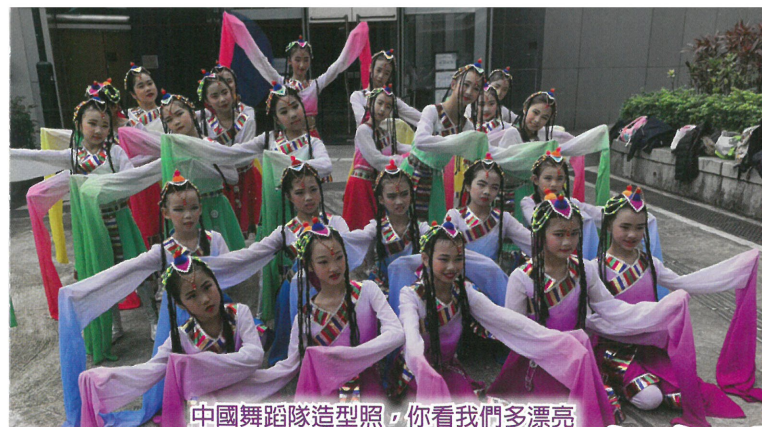
中國舞蹈隊造型照，你看我們多漂亮