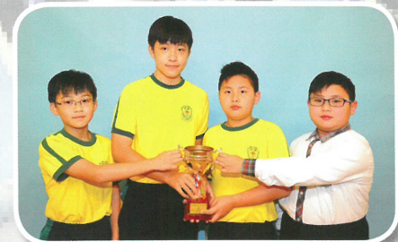
室內單車機比賽團體接力賽男子組季軍