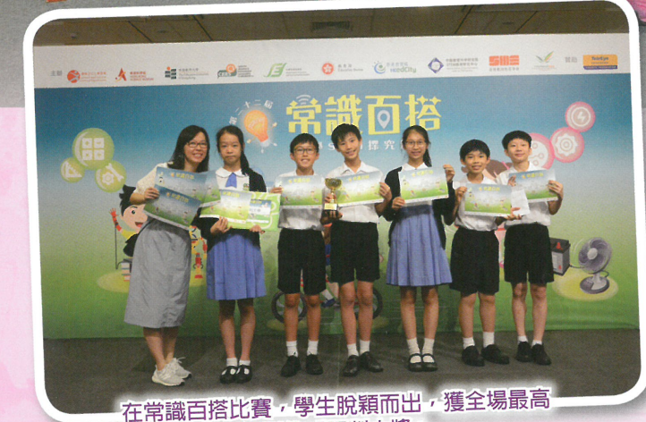
在常識百搭比賽，學生脫穎而出，獲全場最高級別的「評判大獎」