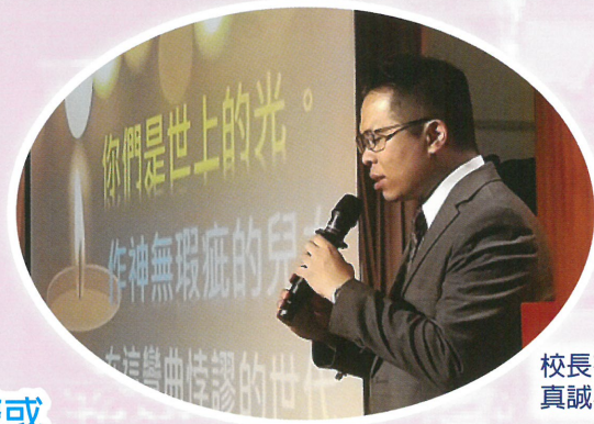
校長在早禱時段，真誠為學生祈禱。

學生在燈泡造型紙上，寫下自己的決志心聲或個人見證，班主任同心合力，將班上學生的燈泡造型紙串連起來，並貼在燈線上。