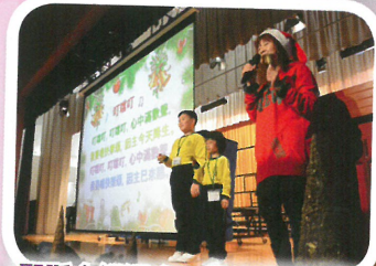
聖誕合組週會，學生載歌載舞