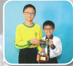
JTA 雜耍競技大賽扯鈴— 雙人過腳季軍