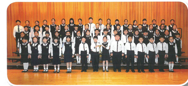
聯校音樂大賽 2019 小學合唱團 (挑戰組) 金獎