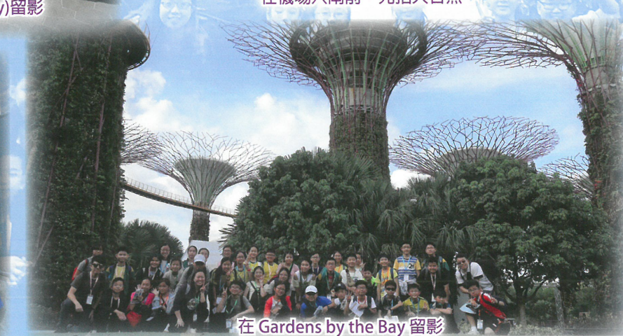
在 Gardens by the Bay 留影