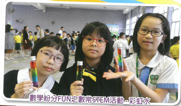
數學紛分FUN之數常STEM活動-彩虹水