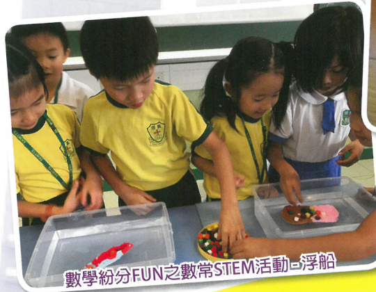
數學紛分FUN之數常STEM活動-浮船