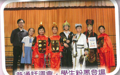
普通話週會，學生粉墨登場