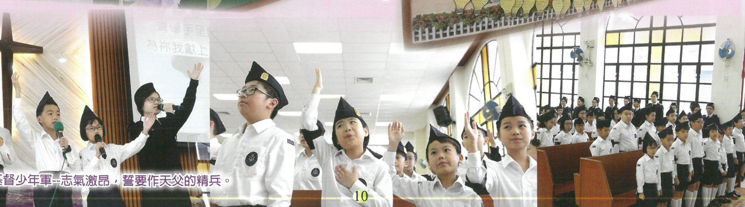
基督少年軍 - 志氣激昂，誓要作天父的精兵。