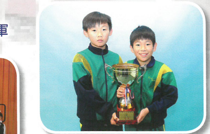
JTA 雜耍競技大賽雜耍球— 二人三波冠軍