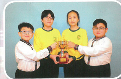
走過自然天地 1819 第三屆全港小學生物速查「100」球蘭獎