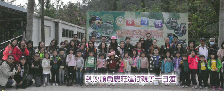
到沙頭角農莊進行親子一日遊