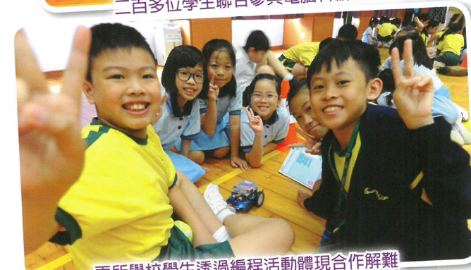
兩所學校學生透過編程活動體現合作解難