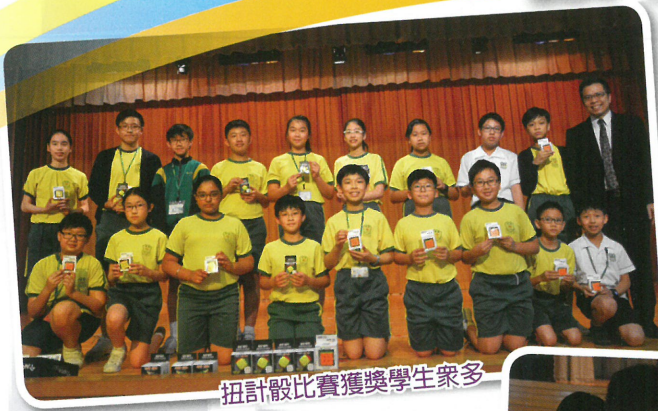
扭計骰比賽獲獎學生眾多