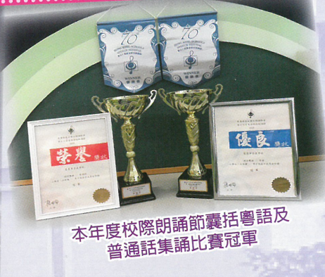
本年度校際朗誦節囊括粵語及普通話集誦比賽冠軍