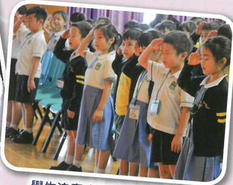
學生決意成為黑暗中的明燈