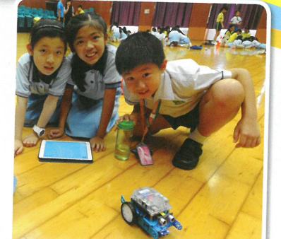
學生小組共同完成mBot機械車編程任務