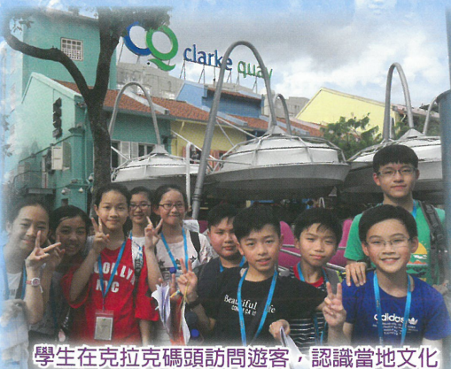
學生在克拉克碼頭訪問遊客，認識當地文化