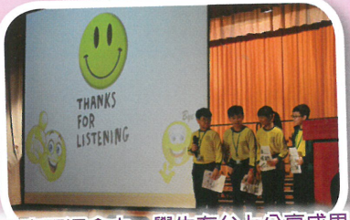
在專研週會中，學生在台上分享成果