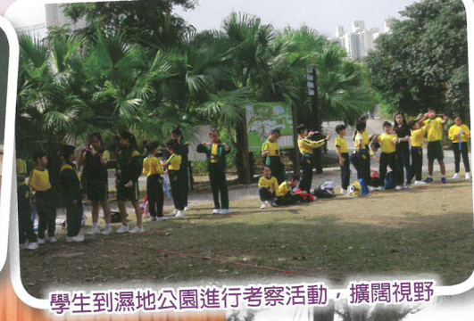
學生到濕地公園進行考察活動，擴闊視野