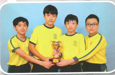
Master Code 編程大賽小公民大 世界小學組季軍