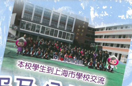
本校學生到上海市學校交流