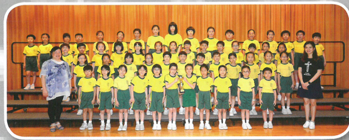
聯校音樂大賽 2019 小學合唱團 (初級組) 金獎