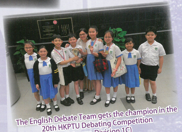
The English Debate Team gets the champion in the 20th HKPTU Debating Competition (Primary, Division 1C)