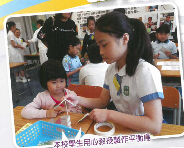
本校學生用心教授製作平衡鳥