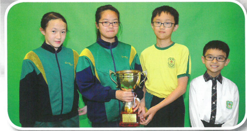
學生才能匯展觀眾票選大獎