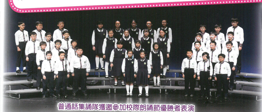
普通話集誦隊獲邀參加校際朗誦節優勝者表演

為了建立學生的自信心，培訓他們參加多個朗誦、故事演講及辯論比賽，學生口才了得，屢獲殊榮。本校學生於香港校際朗誦節粵語及普通話詩詞集誦均榮獲冠軍，其中普通話詩詞男女五、六年級集誦隊更獲邀出席「優勝者表演」；此外，本校學生於本年度東區學校演講比賽於囊括七個獎項，包括粵語組全場總冠軍、小組冠軍、亞軍、季軍，普通話組冠軍、季軍及優異獎，本校辯論隊亦於20th HKPTU Debating Competition 獲得冠軍，成績驕人。除了以上獎項，本校學生參加了不同比賽包括第十屆「國際盃」才藝大賽普通話散文獨誦、詩歌獨誦及兒歌獨誦獲得兩金一銀；第十八屆全港學界普通話傳藝比賽獲得高小古詩組亞軍、繞口令組優良獎；第二十屆全港普通話故事演講比賽獲得多個優異星獎及優異獎。