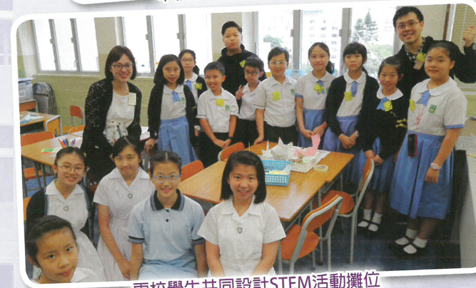
兩校學生共同設計STEM活動攤位