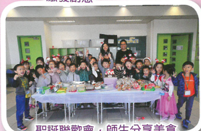
聖誕聯歡會，師生分享美食