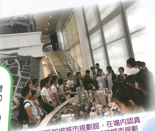
學生參觀新加坡城市規劃館，在場內認真觀看展覽模型，了解新加坡的城市規劃