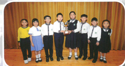
全港青少年雜耍大賽 (21 歲以下) 團體組合表演組亞軍