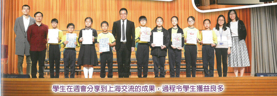
學生在週會分享到上海交流的成果，過程令學生獲益良多