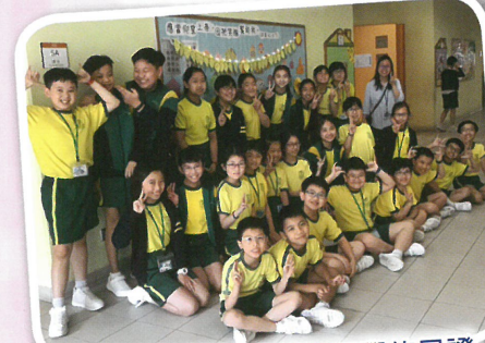
教室外的壁報寫滿各同學的見證