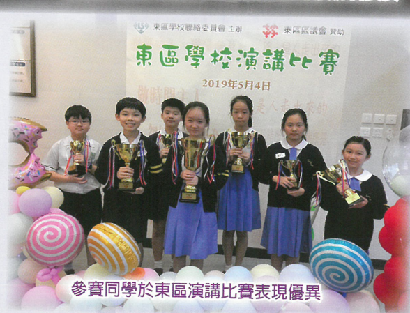
參賽同學於東區演講比賽表現優異