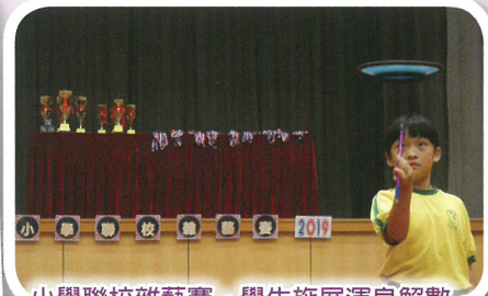
小學聯校雜藝賽，學生施展渾身解數，取得各項佳績