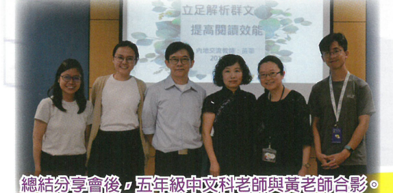
總結分享會後，五年級中文科老師與黃老師合影。