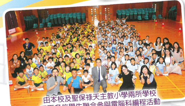
由本校及聖保祿天主教小學兩所學校二百多位學生聯合參與電腦科編程活動