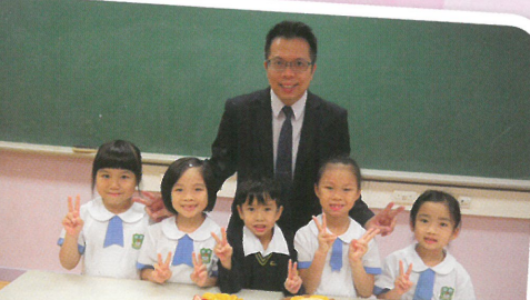
在生日會上，校長與學生合照，一同分享歡樂