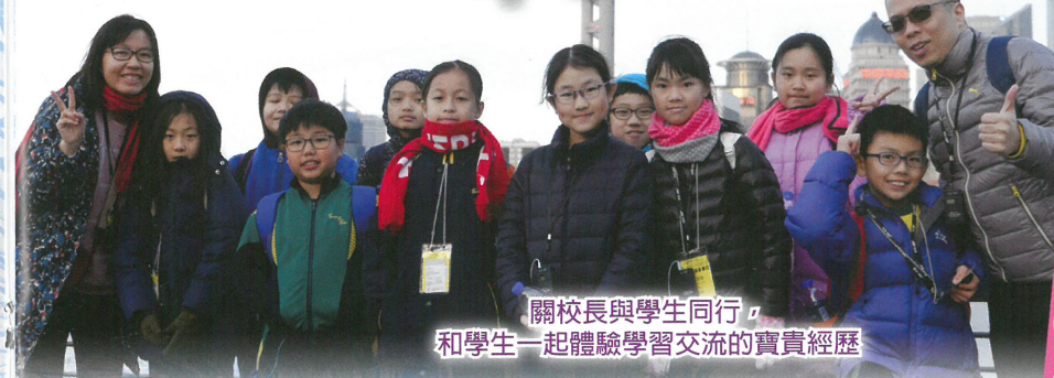
關校長與學生同行，和學生一起體驗學習交流的寶貴經歷