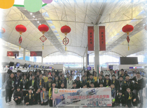
在機場入關前，先拍大合照