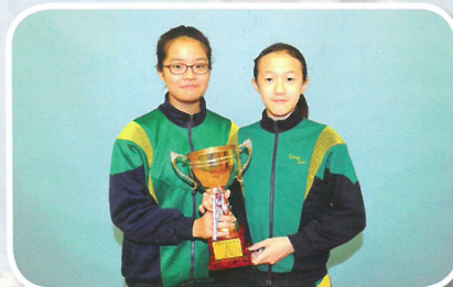
全港青少年雜耍大賽 (21 歲以下) 團體組合表演組亞軍