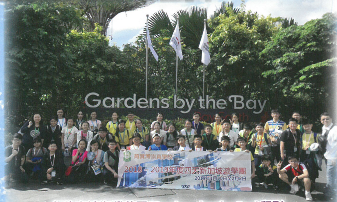
師生在濱海灣花園(Gardens by the Bay)留影