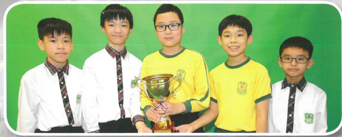
Master Code 擂台戰 Arena 小學組 Minecraft Achiever