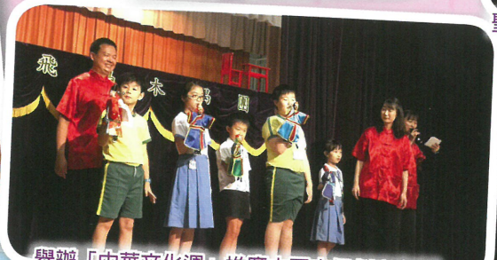
舉辦「中華文化週」推廣中國木偶劇和粵劇，讓同學大開眼界