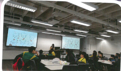
學生參加「小朋友@科大」科學工作坊，激發創意