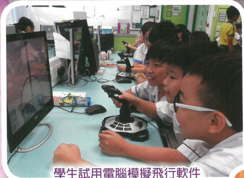
學生試用電腦模擬飛行軟件