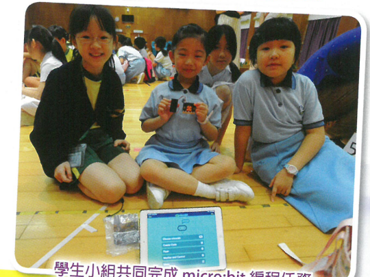
學生小組共同完成 micro:bit 編程任務