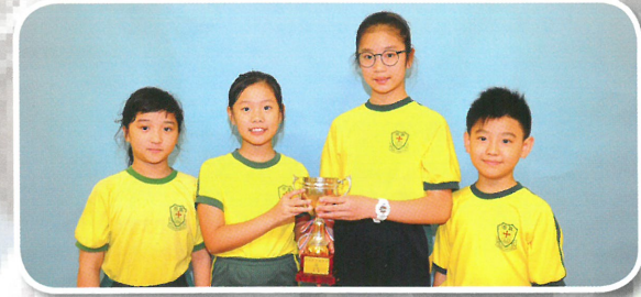
全港學界跳繩比賽 2 分鐘大繩 8 字走位速度賽 港島 2 區小學公開組殿軍