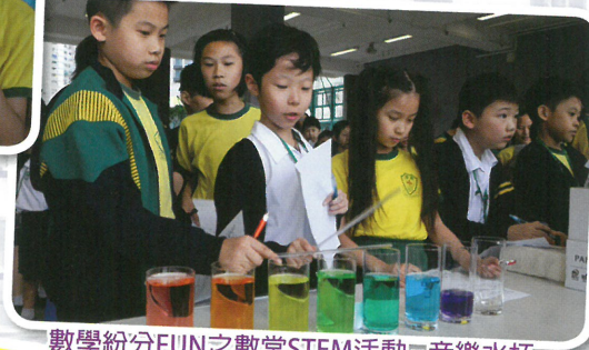
數學紛分FUN之數常STEM活動-音樂水杯