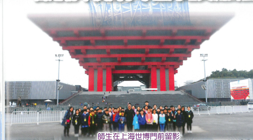
師生在上海世博門前留影