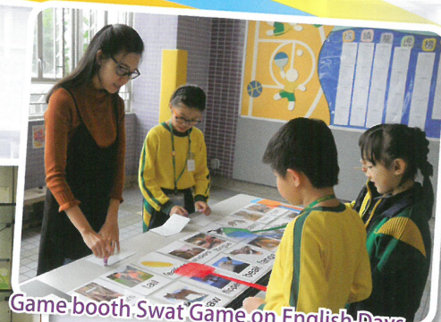
Game booth Swat Game on English Days