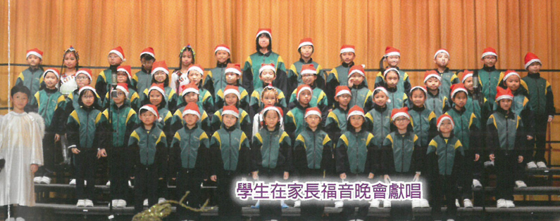
學生在家長福音晚會獻唱