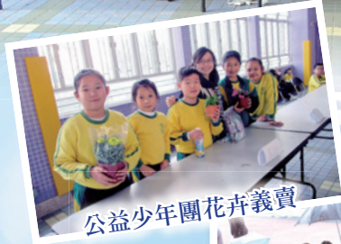
公益少年團花卉義賣