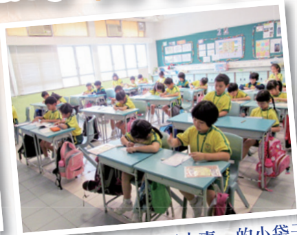
分發「Easy Easy 好小事」的小袋子