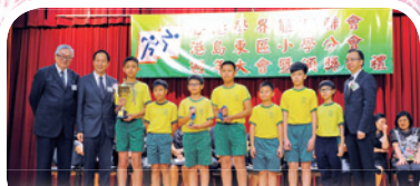
香港學界體育聯會港島東區小學分會 2014-2015 年度港島東區小學校際排球比賽男子組亞軍