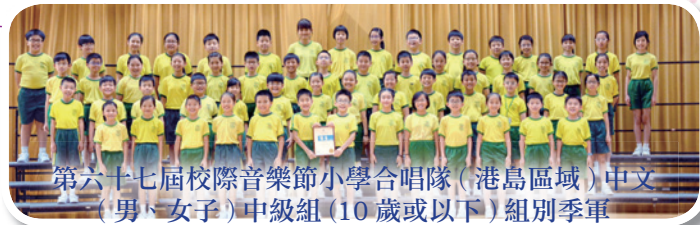
第六十七屆校際音樂節小學合唱隊 (港島區域) 中文 (男、女子) 中級組 (10 歲或以下) 組別季軍