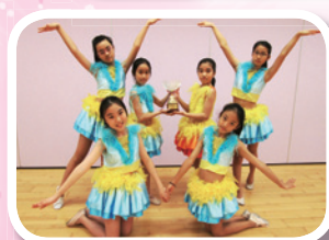
香港學界舞蹈協會主辦第五十一屆學校舞蹈節小學高年級組中國舞 (群舞) 甲級獎