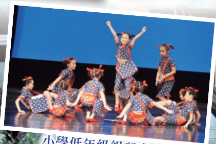
小學低年級組兒童舞 (羣舞)比賽片段