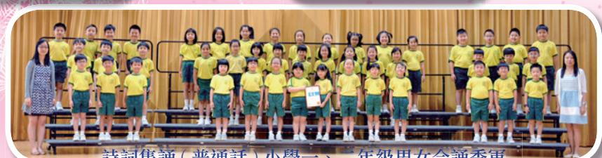
詩詞集誦 (普通話) 小學一、二年級男女合誦季軍