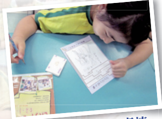
用心寫下感恩的事情