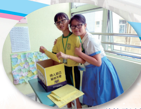
猜情尋活動進行過程