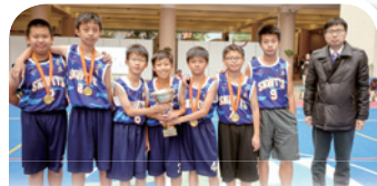
漢華中學 2014-2015 年度校慶盃 3on3 三人籃球邀請賽男子組冠軍