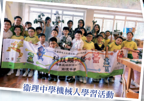
衛理中學機械人學習活動