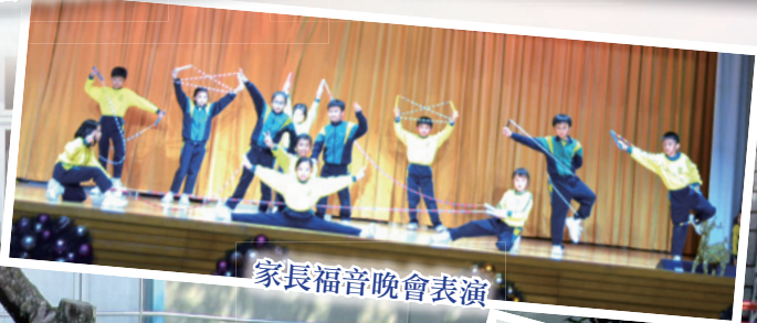
家長福音晚會表演