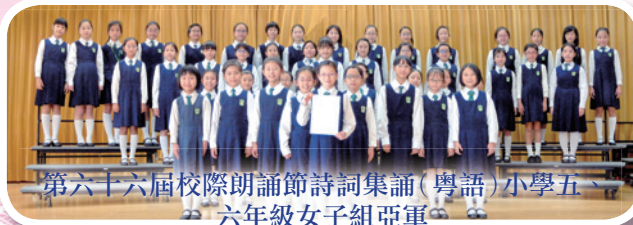
第六十六屆校際朗誦節詩詞集誦 (粵語) 小學五、六年級女子組亞軍