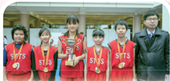
漢華中學 2014-2015 年度校慶盃 3on3 三人籃球邀請賽女子組冠軍