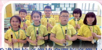
香港聯校音樂協會聯校音樂大賽 2015 小學牧童笛組金獎