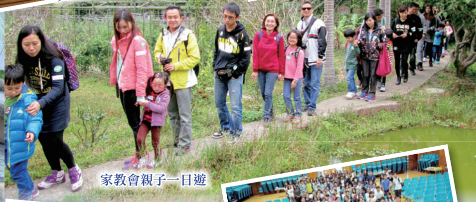
家教會親子一日遊