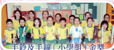
手鈴及手鐘 (小學組) 金獎