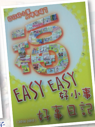
好事日記結集成書