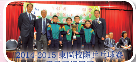
2014-2015 東區校際乒乓球賽 男子甲組冠軍