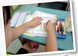
畫下每個感恩的片段