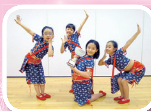
香港學界舞蹈協會主辦第五十一屆學校舞蹈節小學低年級組兒童舞 (群舞) 優等獎