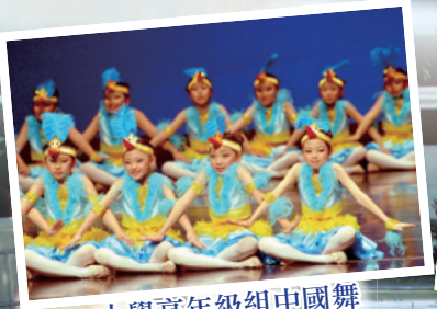
小學高年級組中國舞 (羣舞)比賽片段