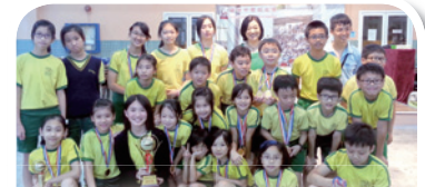
Colour Show Entertainment 主辦小學雜藝聯校賽全場團體冠軍