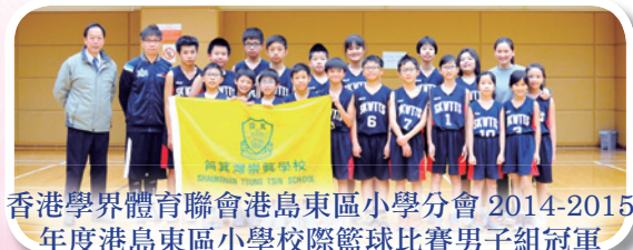
香港學界體育聯會港島東區小學分會 2014-2015 年度港島東區小學校際籃球比賽男子組冠軍