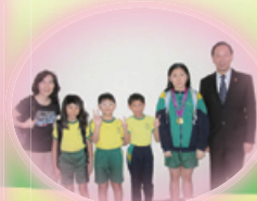
香港學界體育聯會 港九地域游泳比賽 冠軍