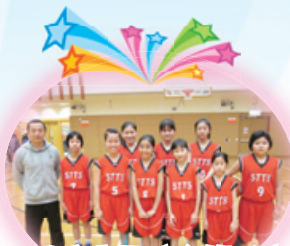
港島東區校際籃球賽 (女子組) 亞軍