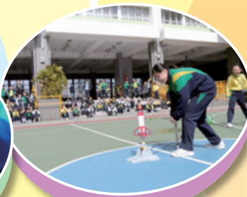
探究水火箭的動力學