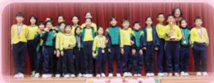
小學雜藝聯校賽團體總冠軍