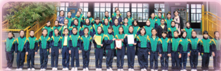
香港學校朗誦節一女子詩詞粵語集誦高組組冠軍