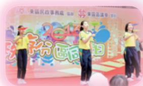
愛秩序分區同樂日 雜藝表演

升中派位成績理想： 七成學生獲派第一志願的中學，九成以上學生獲派首三個志願的中學。