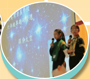
學生匯報學習成果