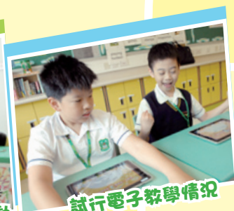
試行電子教學情況