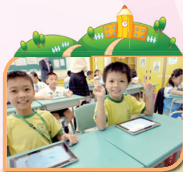
使用平板電腦學習

本校同學亦積極參與外界資訊科技比賽活動，曾獲得電子書設計比賽冠軍和季軍、全港小學電腦掃描比賽銀獎等卓越成就。