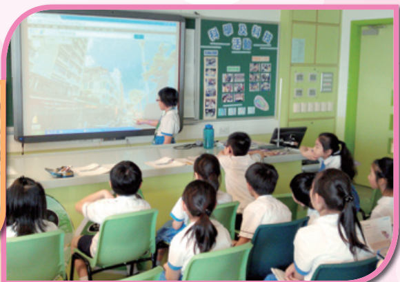
使用電子白板學習