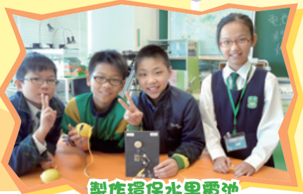
製作環保水果電池