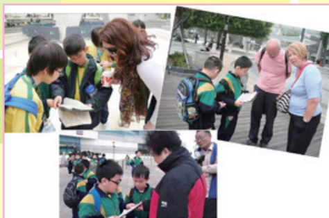
到尖沙嘴訪問遊客