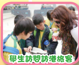
學生訪問訪港旅客