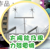
太陽能及風力發電機