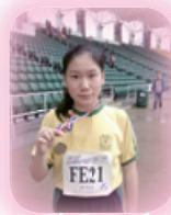
東區分齡田徑賽女 子組400米冠軍