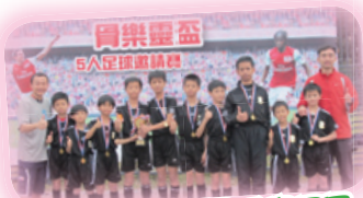
音樂盃五人足球賽冠軍