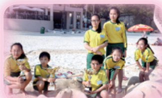
公益少年團堆沙比賽冠軍