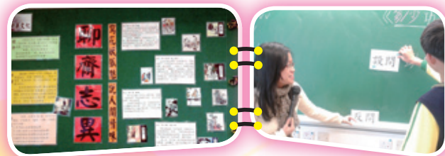
中文科中華文化—古典小說

滲入資優教育的元素：利用不同層次的提問，提升學生的高階思維，令學生將文章內容及語文知識融會貫通。