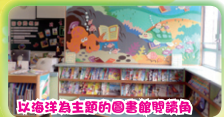
以海洋為主題的圖書館閱讀角