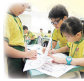
專研週—參觀中央圖書館