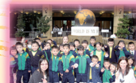
專研週—參觀中央圖書館