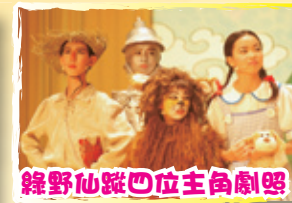
綠野仙蹤四位主角劇照