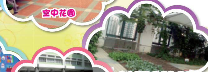
空中花園種植的植物