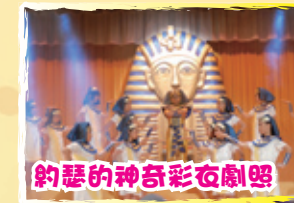
約瑟的神奇彩衣劇照

大型英文音樂劇：動員外籍老師、英文科、音樂科及校外導師訓練學生，讓他們活用英語。學生在參與過程非常投入，將團隊精神發揮得淋漓盡致。