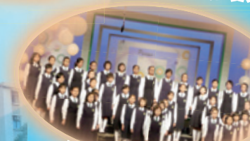
女子粵語集誦冠軍