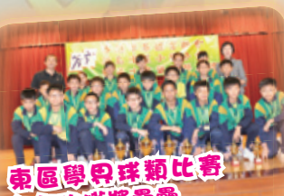
東區學界球類比賽 每年均獲獎榮譽

升中派位成績理想 ：七成學生獲派第一志願的中學，九成以上學生獲派首三個志願的中學。