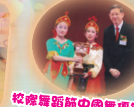
校際舞蹈節中國舞優等獎