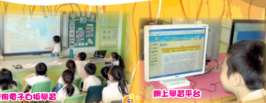
使用電子白板學習

本校同學亦積極參與外界資訊科技比賽活動，曾獲得電子書設計比賽冠軍和季軍、全港小學電腦掃描比賽銀獎等卓越成就。