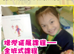
增潤課程——全班式課程