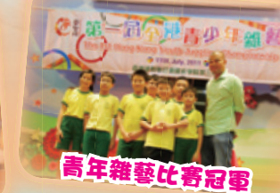
青年雜藝比賽冠軍