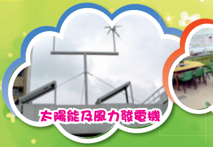
太陽能及風力發電機